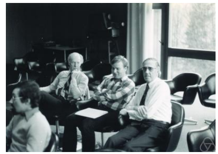
De droite à gauche : Edmond Malinvaud, Yves Balasko (en) et Gérard Debreu, en 1977

La promotion 2007 de l'École nationale de la statistique et de l'administration économique (ENSAE) porte son nom.