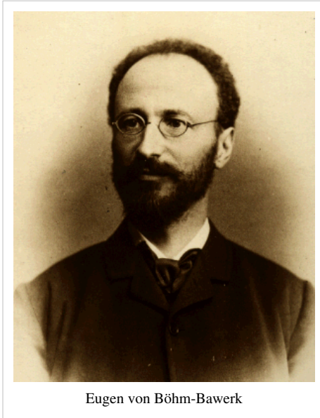
Eugen von Böhm-Bawerk