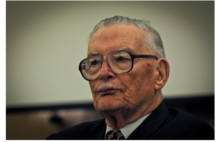
James M. Buchanan