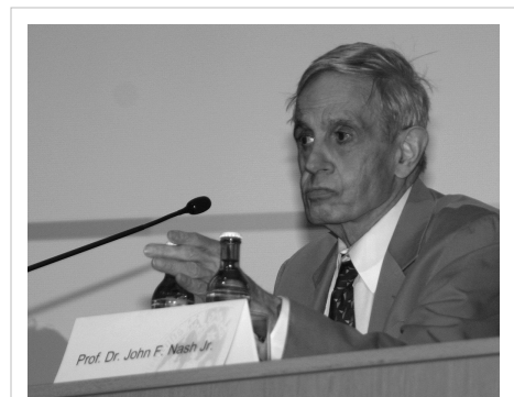
Nash en 2006