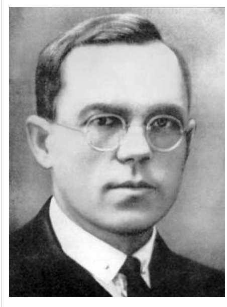
Portrait de Nikolaï Dmitrievitch Kondratiev